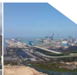
Port Jorf Lasfar