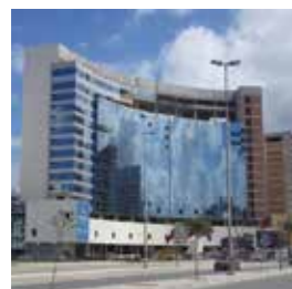
Hôtel Hilton, Tanger

Pour maintenir sa position de leader, Smm-Socodam-Davum n'a cessé depuis 1997, date de modernisation de l'activité armatures, d'accroître sa capacité de production et d'optimiser son outil de production afin d'assurer à ses clients des prix compétitifs et des produits adaptés à leurs besoins.