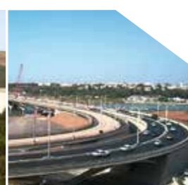
Pont Moulay El-Hassan