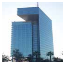
Tour Maroc Telecom, Rabat