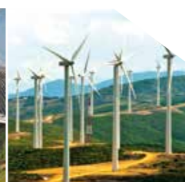
Parc éolien, Tanger