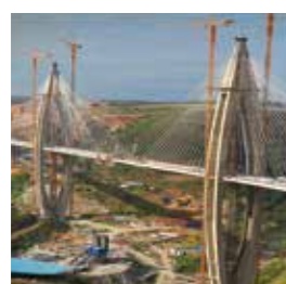
Pont à haubans, Rabat